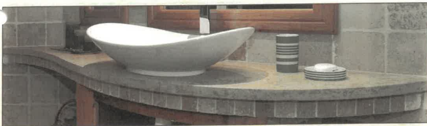
Plan de meuble supportant une vasque en taille adoucie, coloris marbré.