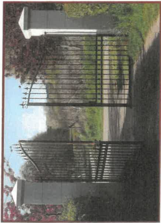
Pilier en taille égyptienne avec chapeaux en pointe diamant.