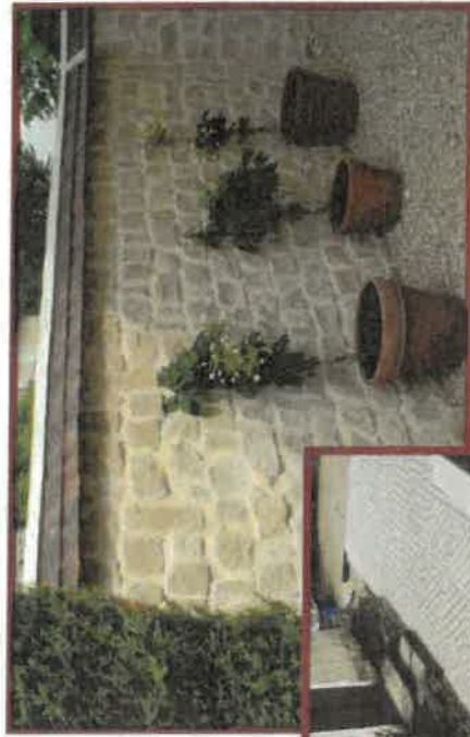
Pour tous vos projets de construction, n'hésitez pas à nous consulter.

Composez à votre idée pavés et moellons dans des formats symétriques ou irréguliers pour épouser astucieusement les tracés de votre jardin.