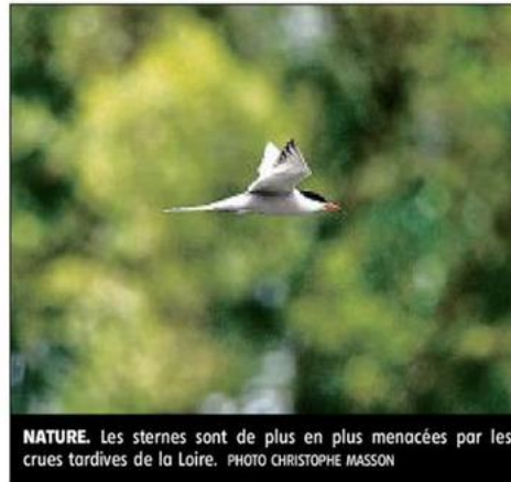
NATURE. Les sternes sont de plus en plus menacées par les crues tardives de la Loire.

Cette opération a donc été spontanée. Le temps administratif n'étant pas celui de l'eau de la crue, il a fallu que la LPO pare au