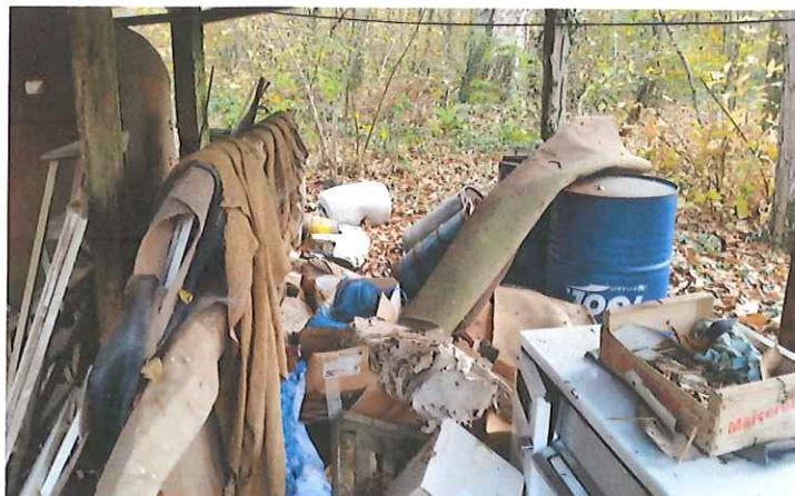
Annexe n° 3