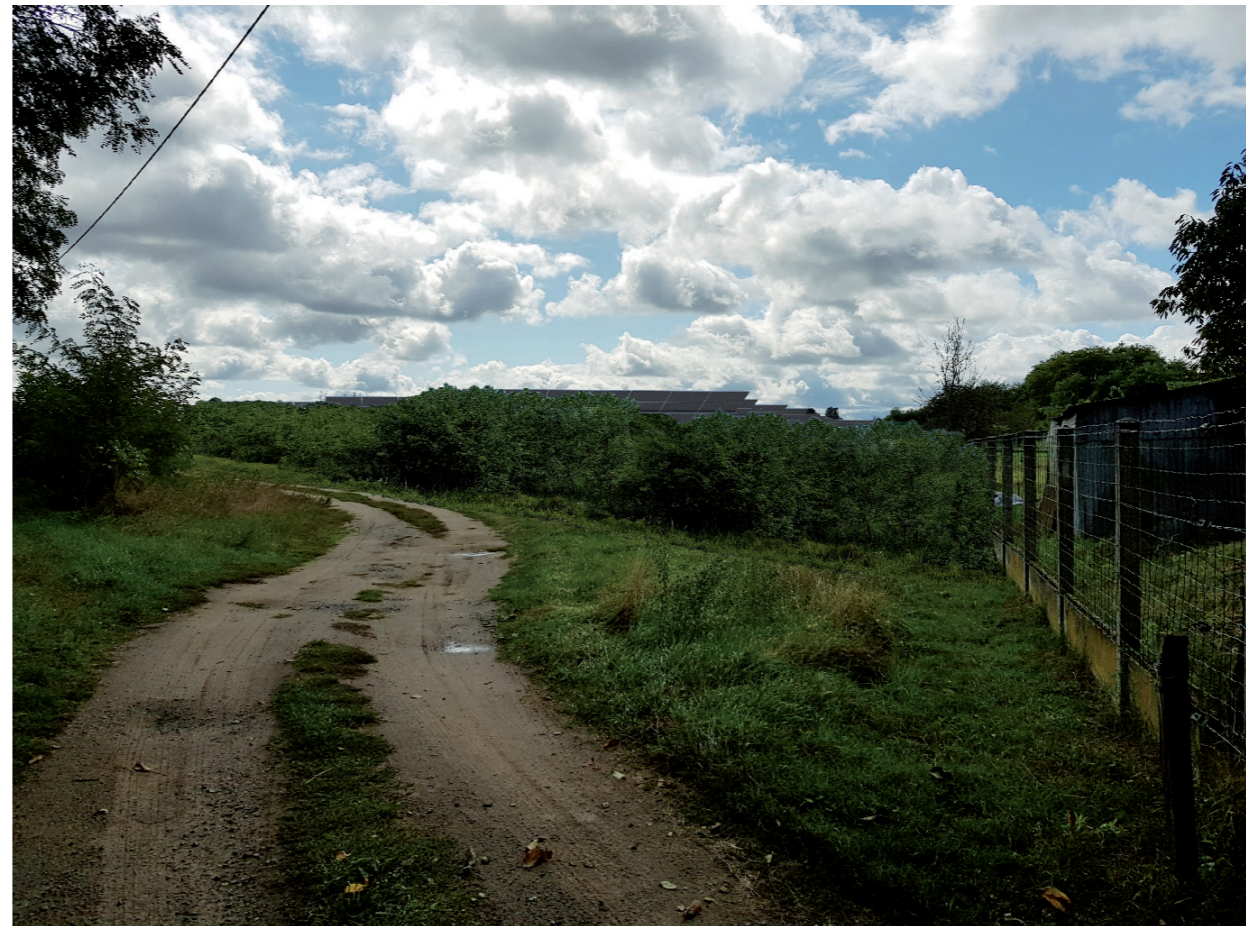
PHOTOMONTAGE 7 - Phase exploitation avec haie paysagère