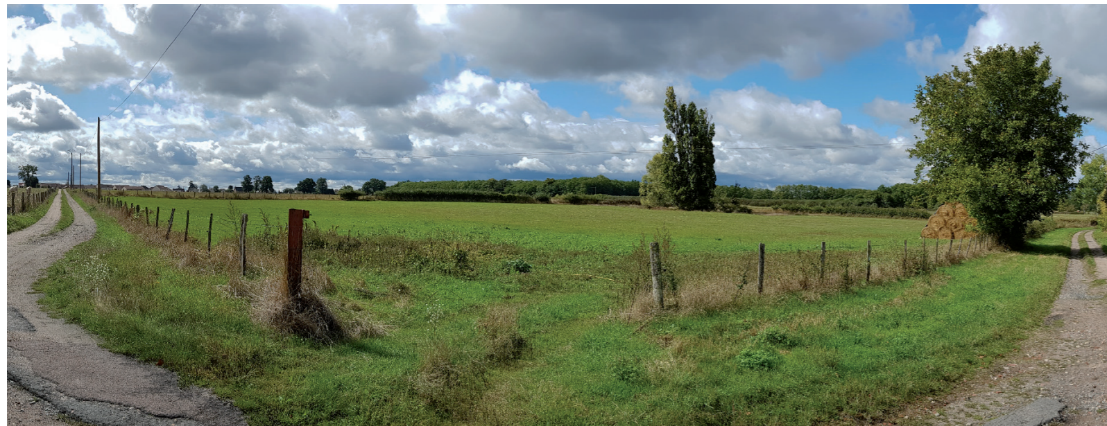
PHOTOMONTAGE 6 - Situation existante