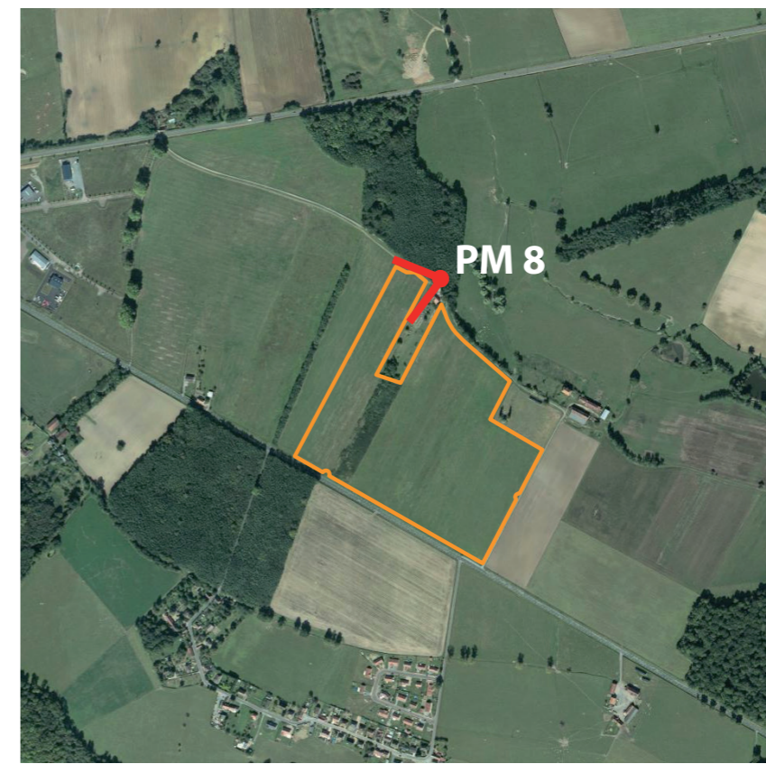
Localisation de la prise de vue