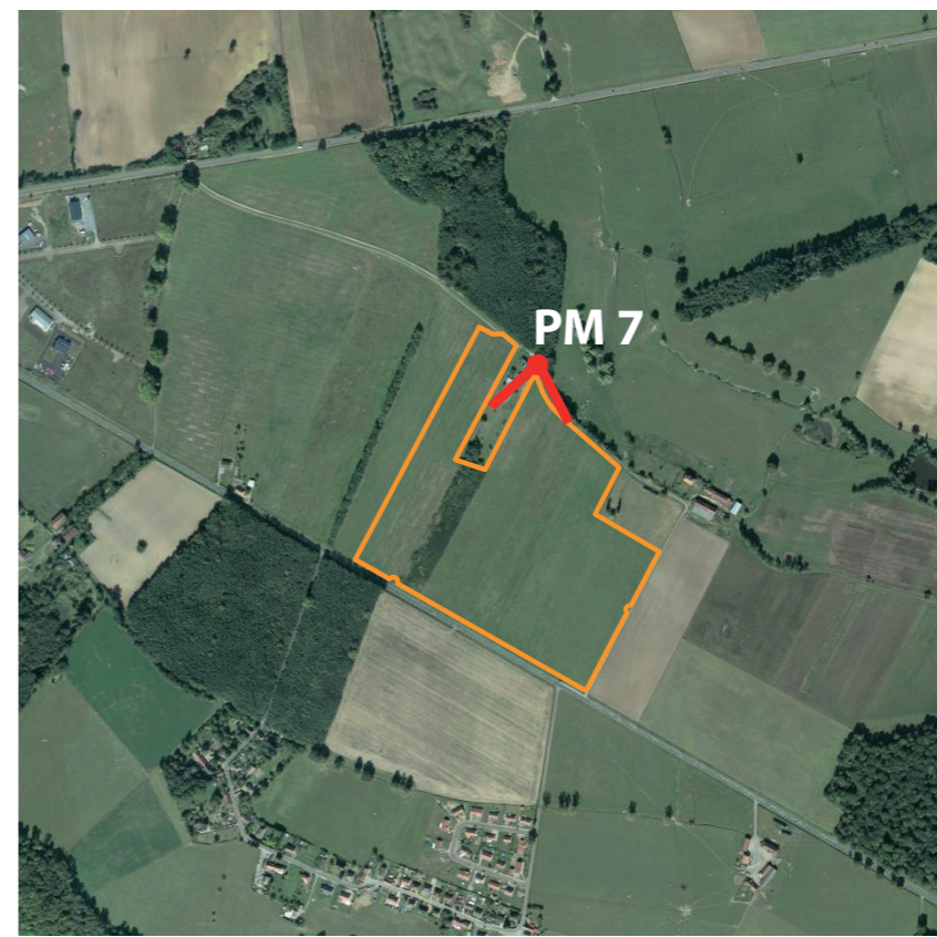
Localisation de la prise de vue