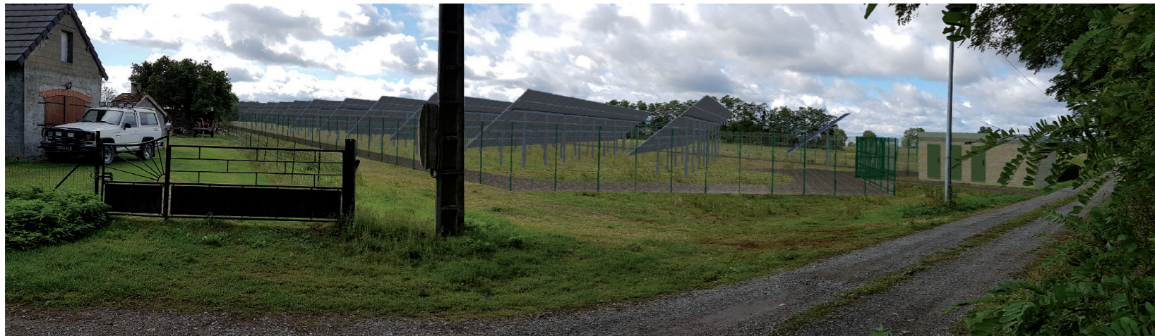
PHOTOMONTAGE 8 - Phase exploitation sans haie paysagère