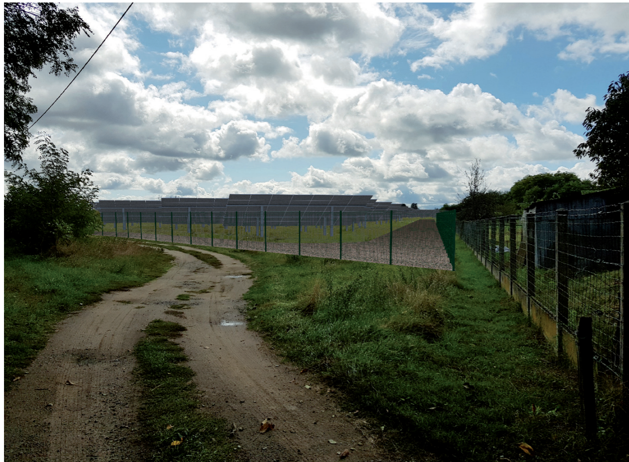
PHOTOMONTAGE 7 - Phase exploitation sans haie paysagère

PHOTOMONTAGE 7 : Vue depuis le chemin d'accès au site.