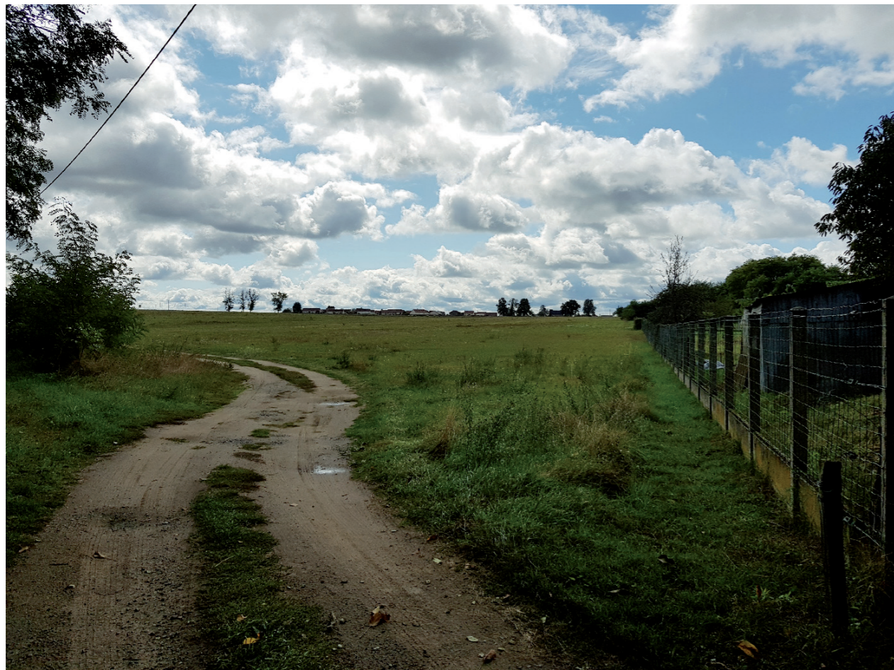
PHOTOMONTAGE 7 - Situation existante