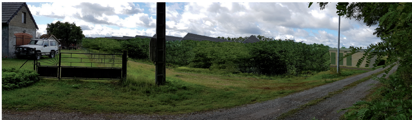
PHOTOMONTAGE 8 - Phase exploitation avec haie paysagère