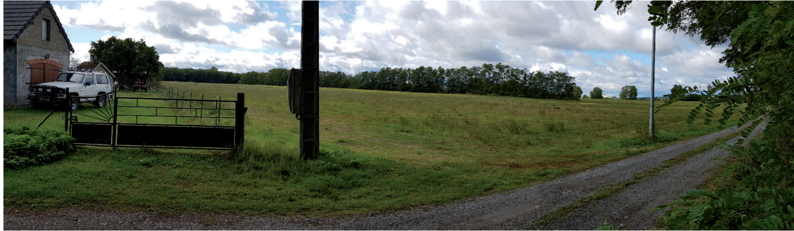
PHOTOMONTAGE 8 - Situation existante