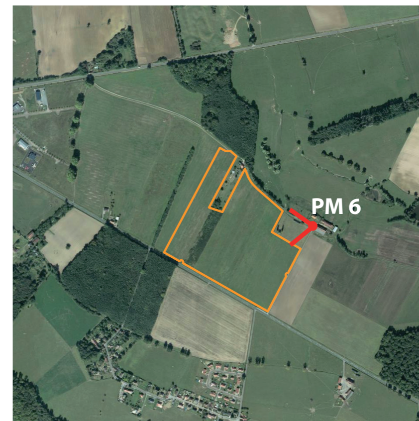
Localisation de la prise de vue