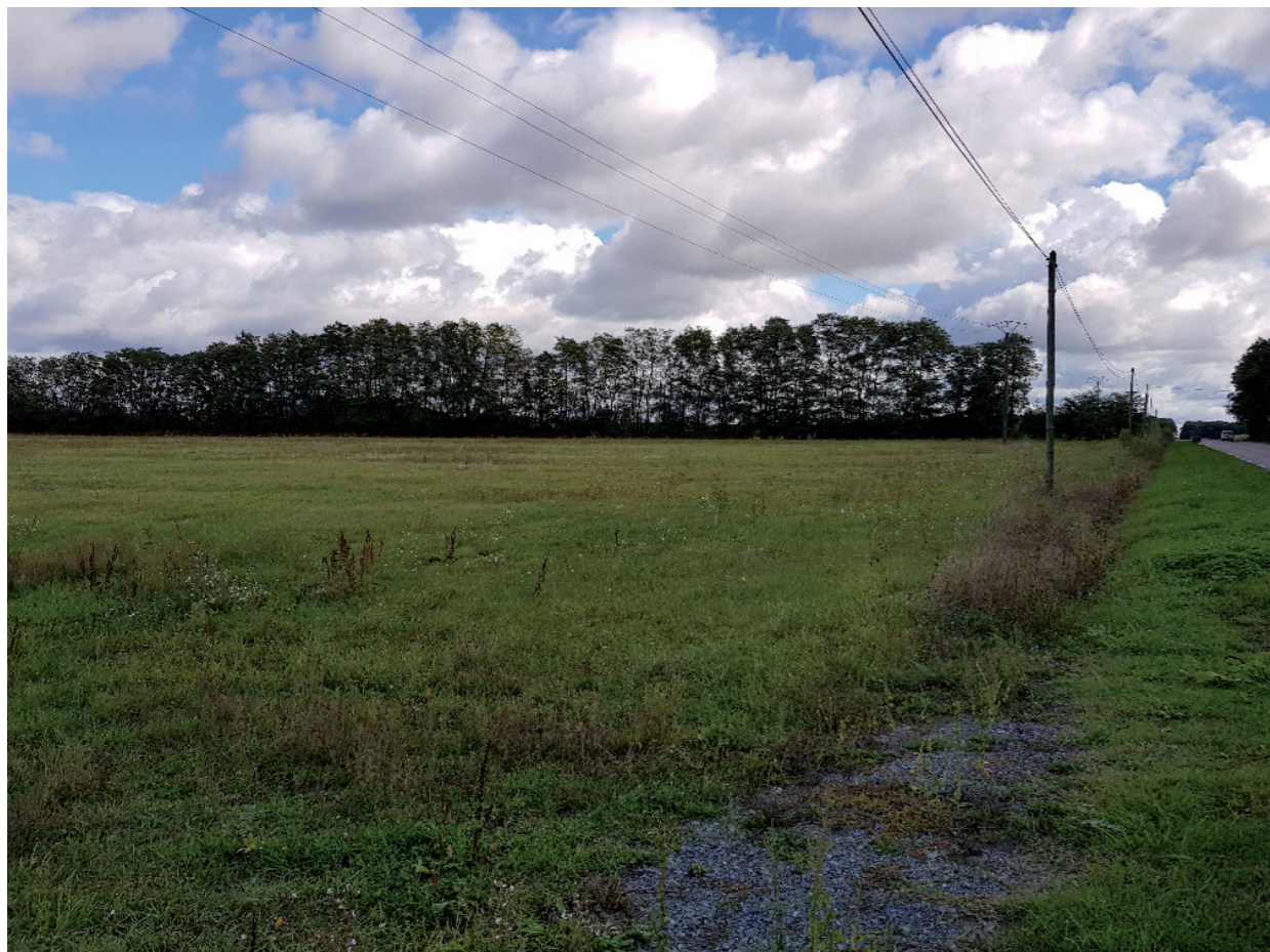
Vue éloignée 5 : Vue depuis la route départementale 979, au sud-ouest du site projet.