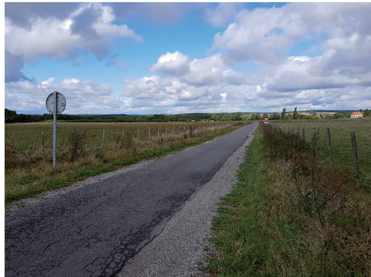
Vue éloignée 6 : Vue depuis l'entrée du lieu-dit Village de Brain.