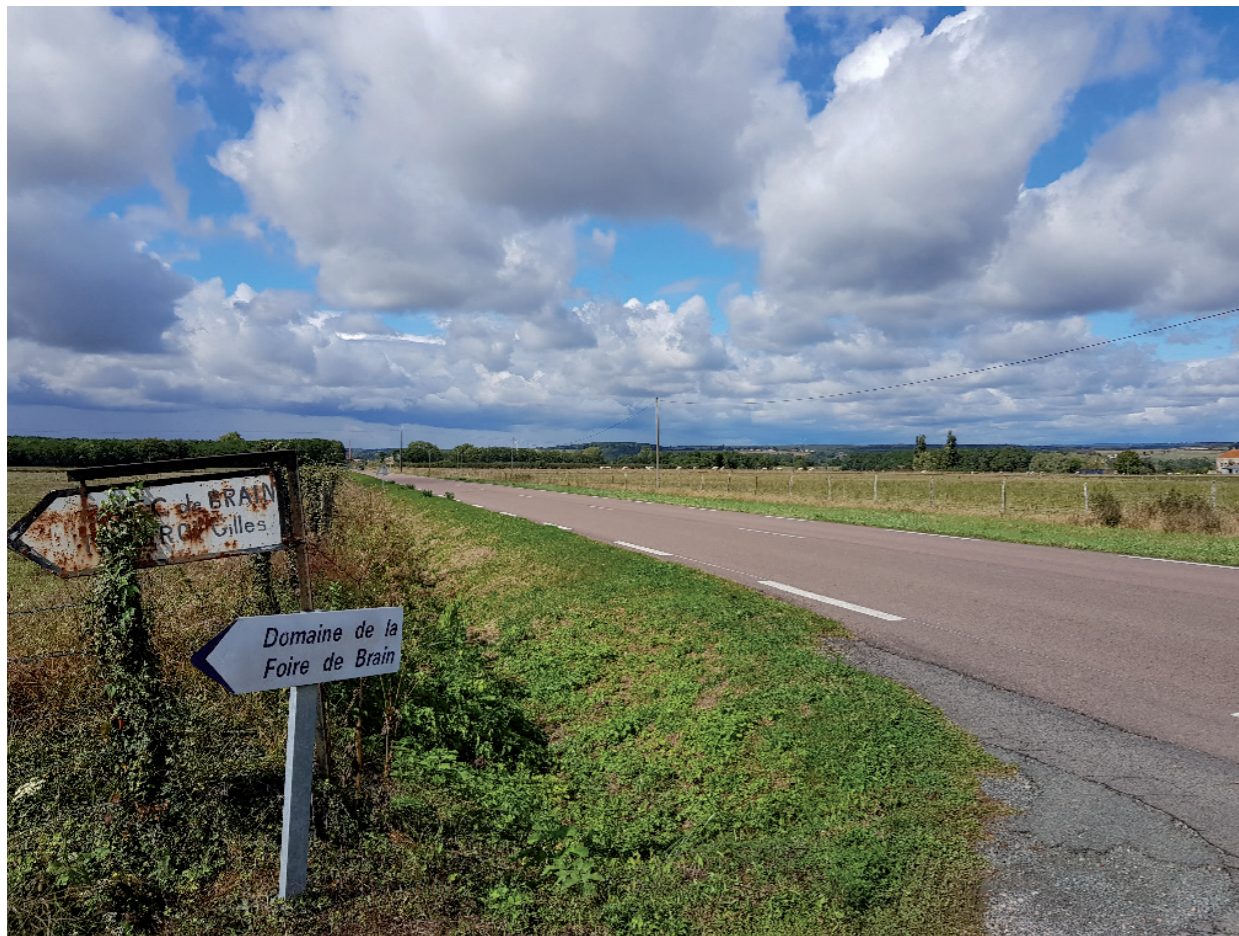
Vue éloignée 4 : Vue depuis la route départementale 979, au niveau du lieu-dit Foire de Brain.